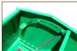
Semilla variable y caja de fertilizante