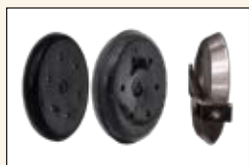
Ruedas control de ajuste