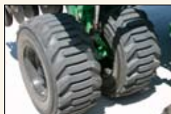
Llantas de alta flotacion