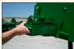
Bandeja de Calibración