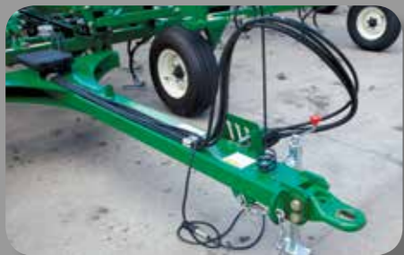
PERFIL BAJO DEL TIRON - El diseño novedoso de perfil bajo, con enganche de uso rudo, cuenta con un área especial para las mangueras hidráulicas