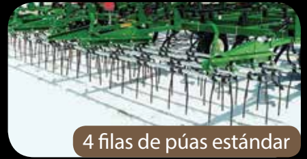
4 filas de púas estándar