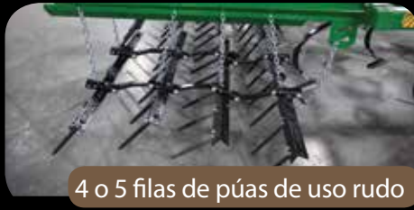
4 o 5 filas de púas de uso rudo