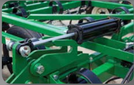
SISTEMA DE CIERRE - Este sistema ha sido mejorado, contando ahora con nuevas bisagras en los bastidores centrales y laterales