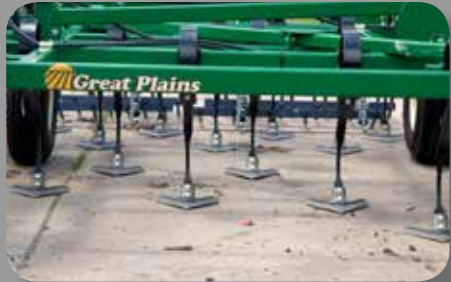
TIMONES MEJORADOS - El espaciamiento de los timones a lo ancho del implemento, y en especial alrededor de las llantas, no es nunca menor a 71 cm