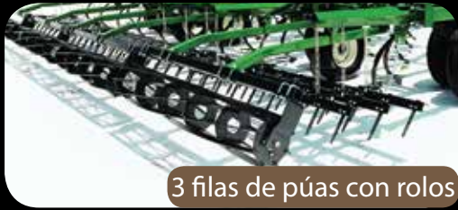
3 filas de púas con rolos