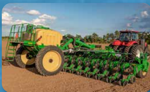
Disponibil pentru a gamă variată de modele!